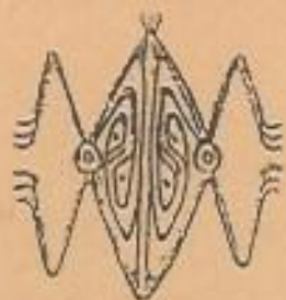
No.4 AYE MEHELE-motief = vogelpoot.