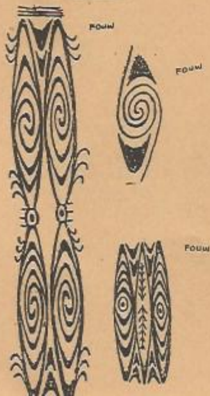
No.7 FOUW-MOTIEF = spiraal/cirkel.

Er bestaan verscheidene FOUW-afbeeldingen, maar ze hebben allen dezelfde betekenis en wel het vertellen over het dorpsleven, waarin het dorpshef/dstam-hoofd een zeer belangrijke rol speelt. Het leven in het dorp stelt men voor als een cirkel waarin de dorpingen/stamleden elkaar steunen en er een algemeen diep respect is voor het stamhoofd (ONDOWAFI). Aan de andere kant werkt de Ondowafi samen met andere stamhoofden (KOSELO) om de onderlinge samen-werking in stand te houden. Ook moet hij (het stamhoofd) er voor zorgen dat er altijd genoeg "zegen" is (voedsel in de vorm van wild) en ook ander voedsel zoals: knollen, vis etc. Met andere woorden, het in evenwicht houden van de economie in het dorp. Iedere familie in de stam staat het beste deel van zijn jachtopbrengst, visvangst of ander vergaard voedsel, af aan het stamhoofd met als bedoeling dit te gebruiken voor speciale gelegenheden, zoals de traditionele feesten.